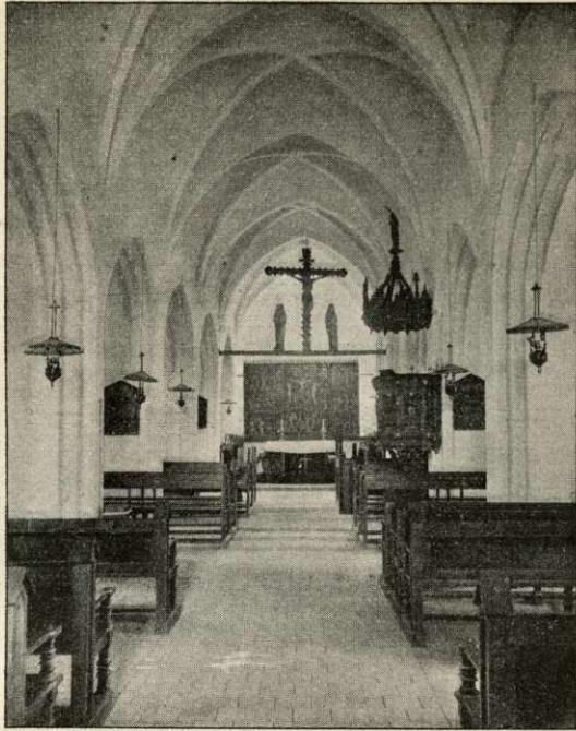
Holmstrup Kirkes Indre.

omgives af Annekset Agnsø, Bregninge og Værsløv S. samt Ars Hrd. (Udby S.). Kirken ligger c. 11 km ØSØ. for Kalundborg. De imod S. noget lerede, men i øvrigt sandede, stenede og grusede Jorder er gennemgaaende højtliggende, især mod S., og for det meste jævne; fra Faksebjærg paa Stengaardens Mark er der smuk og vid Udsigt. Langs Bregninge Aa, der danner Grænsen mod NØ. og N., er der Enge og Moser (Viskinge Mose). Gennem Sognet gaar Kalundborg-Holbæk Landevej og den nordvestsjæll. Bane, samt ved Vestgrænsen Hørv-Værsløv Banen.