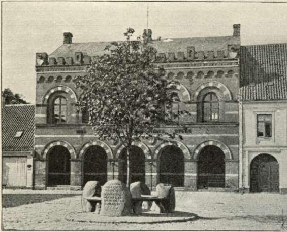
Torvet med Raadhuset og Genforeningsmindesmærket.

Ingeniør Leth og tilhører Kommunen. Det har 2 Dieselmotorer (25 og 50 HK.) og producerer aarlig 48,000 KWT.